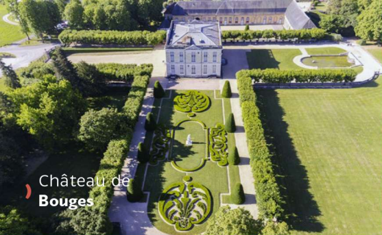
Château de Bouges