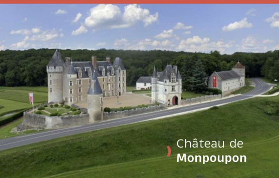
Château de Monpoupon