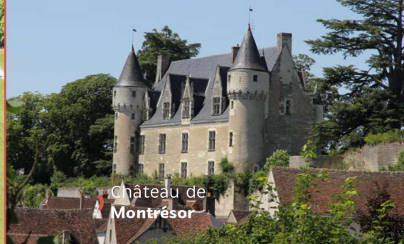
Château de Montrésor