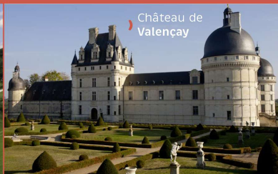
Château de Valençay