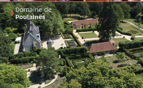
Domaine de Poulaines